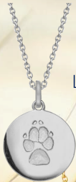
LM1401WP (925 Silber)