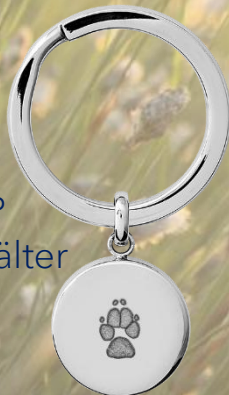
LM1122WP Inkl. Aschebehälter (Edelstahl)