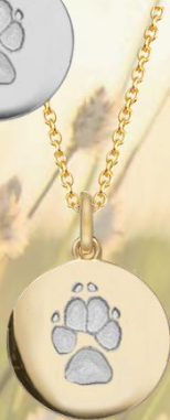
LM1401GP (18k vergoldet)