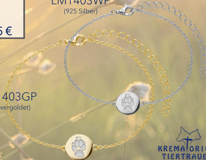
LM1403GP (18k vergoldet)