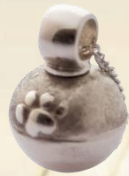
Fini mit Pfote